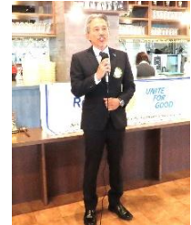
▲水川次年度会長 閉会挨拶