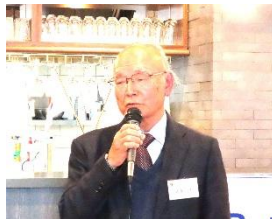
▲プロバスクラブ 早崎会長挨拶