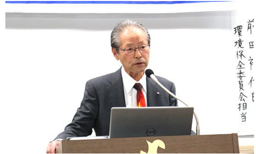
▲宮宅ガバナー補佐挨拶