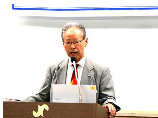
▲宮宅ガバナー補佐挨拶