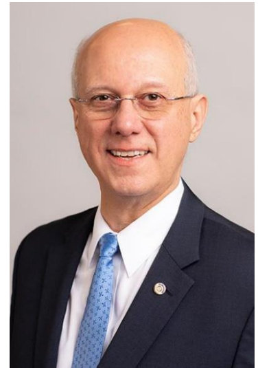
2025-26 年度国際ロータリー会長に選ばれたブラジルのマリオ・セザール・マルティンス・デ・カマルゴ氏 (サントアンドレ・ロータリークラブ)