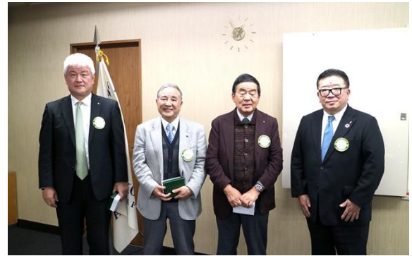
▲ロータリー連続出席表彰