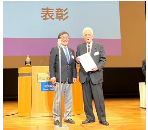
ロータリー在籍65年表彰 神木会員