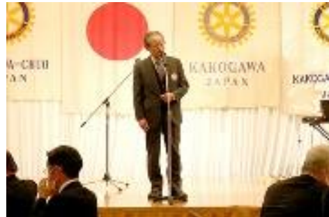
▲次年度宮宅ガバナー補佐閉宴挨拶