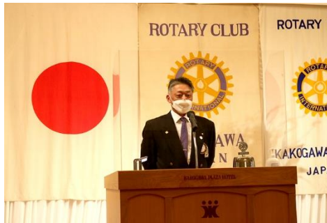
▲加古川平成RC林副会長挨拶