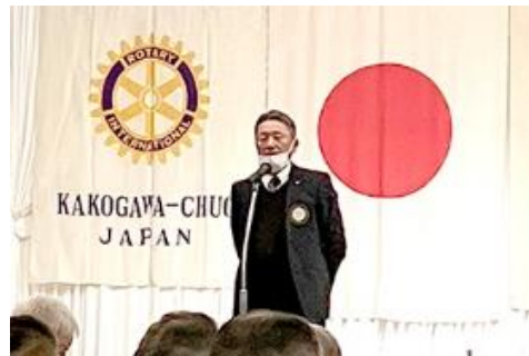
▲加古川平成RC榎直前会長 開演挨拶・乾杯の発声