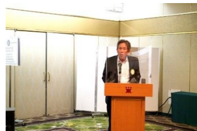
▲橋本米山記念奨学会 委員長